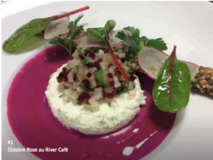
#1 Octobre Rose au River Café