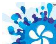
Les Croisières Electro s'invitent sur la Seine 09/11/11 Lire l'article

Nos articles NUITS PARISIENNES sur sortiraparis.com