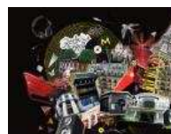
Les Nuits Capitales, ça ressemble à quoi ? 04/11/11 Lire l'article