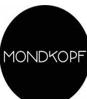
In Paradisum (Paris 10)

Nos articles NUITS PARISIENNES sur sortiraparis.com