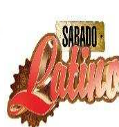
Sabado Latino – La Soirée la plus Caliente de la capitale (Paris 13)