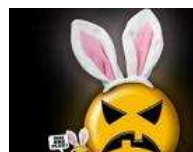
Halloween : 5 façons de faire l'impasse 24/10/11 Lire l'article