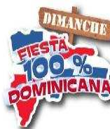
Fiesta 100% Dominicana avec cours de bachata (Paris 13)

NE MANQUEZ PAS La sélection de la rédaction