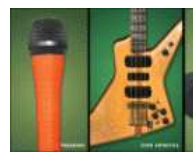
Le Hard Rock Café fête Halloween avec les [...] 21/10/11 Lire l'article